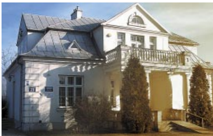
Siedziba Muzeum Historycznego przy ul. Mickiewicza 23