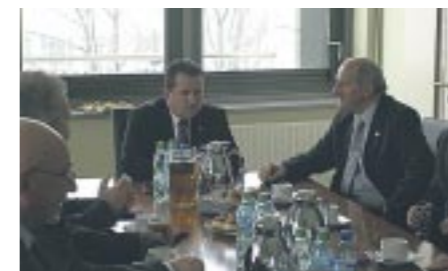
Ambasador na spotkaniu z Prezydentem