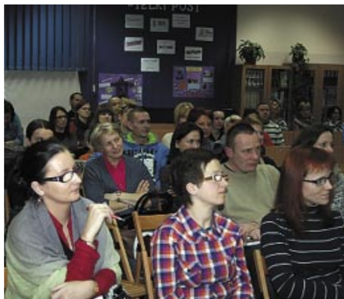
Spotkanie w SP nr 4

W Szkole Podstawowej nr 7 Dni Otwarte trwały od 4 do 8 marca. Goście oglądali zajęcia w oddziałach przedszkolnych, klasach pierwszych oraz zajęcia z języka angielskiego przeprowadzone w klasach drugiej oraz trzeciej. Podczas Dni Otwartych w Zespole Szkolno-Przedszkolnym nr 2 psycholog oraz pedagog przedstawiły informacje na temat dojrzałości szkolnej i organizacji pomocy psychologiczno-pedagogicznej. W Zespole Szkół nr 3 rodzice uczestniczyli w prelekcji na temat różnic programowych między oddziałem przedszkolnym a pierwszą klasą szkoły podstawowej. Szkoła przygotowała również prezentację multimedialną, w której zostały przedstawione jej atuty i osiągnięcia. 14 marca rodzice wysłuchali informacji na temat organizacji pracy w klasach pierwszych w Zespole Szkolno-Przedszkolnym, zwiedzali sale lekcyjne, oglądali wystawę prac uczniów, prezentację multimedialną o rozwijaniu talentów oraz mieli okazję porozmawiać z nauczycielami klas II i III. Dzieci mogły w tym czasie pobawić się na sali zabaw lub wziąć udział w zajęciach przygotowanych przez nauczycieli świetlicy szkolnej. 19 marca był Dzień Otwarty w Zespole Szkół nr 1. W Szkole Podstawowej nr 8 odbyło się