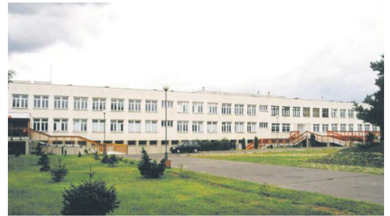
Szkoła Podstawowa nr 3 w Legionowie, lata 90. XX w. (ze zbiorów Muzeum Historycznego w Legionowie).

przy współudziale Kościuszkowców tysięcy czterystu sześćdziesięciu uczniów mogło rozpocząć naukę w obecnym budynku.