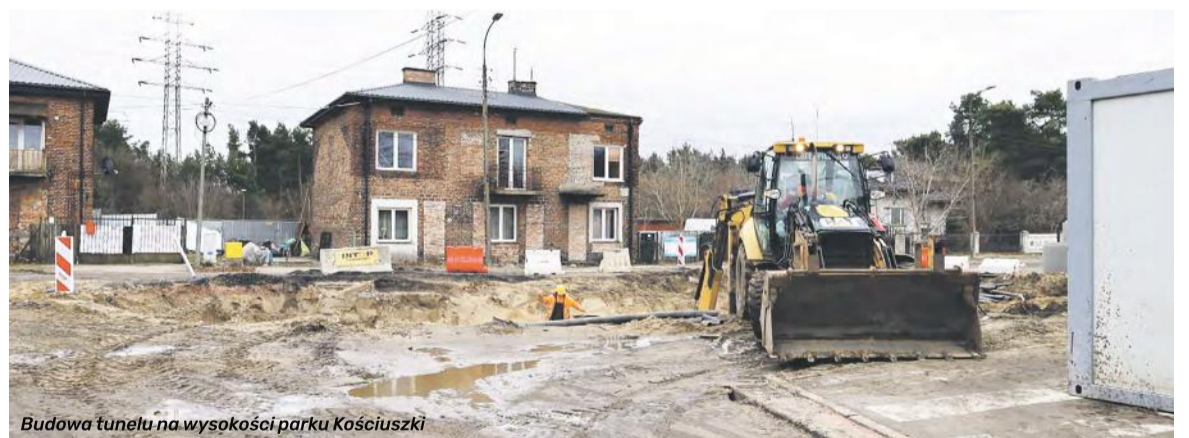
Budowa tunelu na wysokości parku Kościuszki

z czego 14 524 571,85 zł pokryje strona PKP przy wsparciu dofinansowania z UE, a 17 275 428,15 zł Gmina Legionowo.