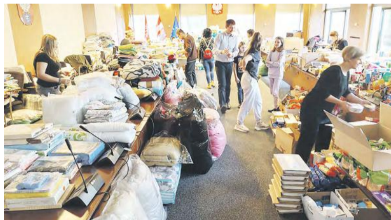
Zbiórka w Urzędzie Miasta Legionowo, sala konferencyjna