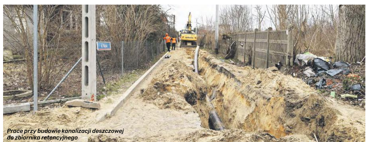
Prace przy budowie kanalizacji deszczowej do zbiornika retencyjnego