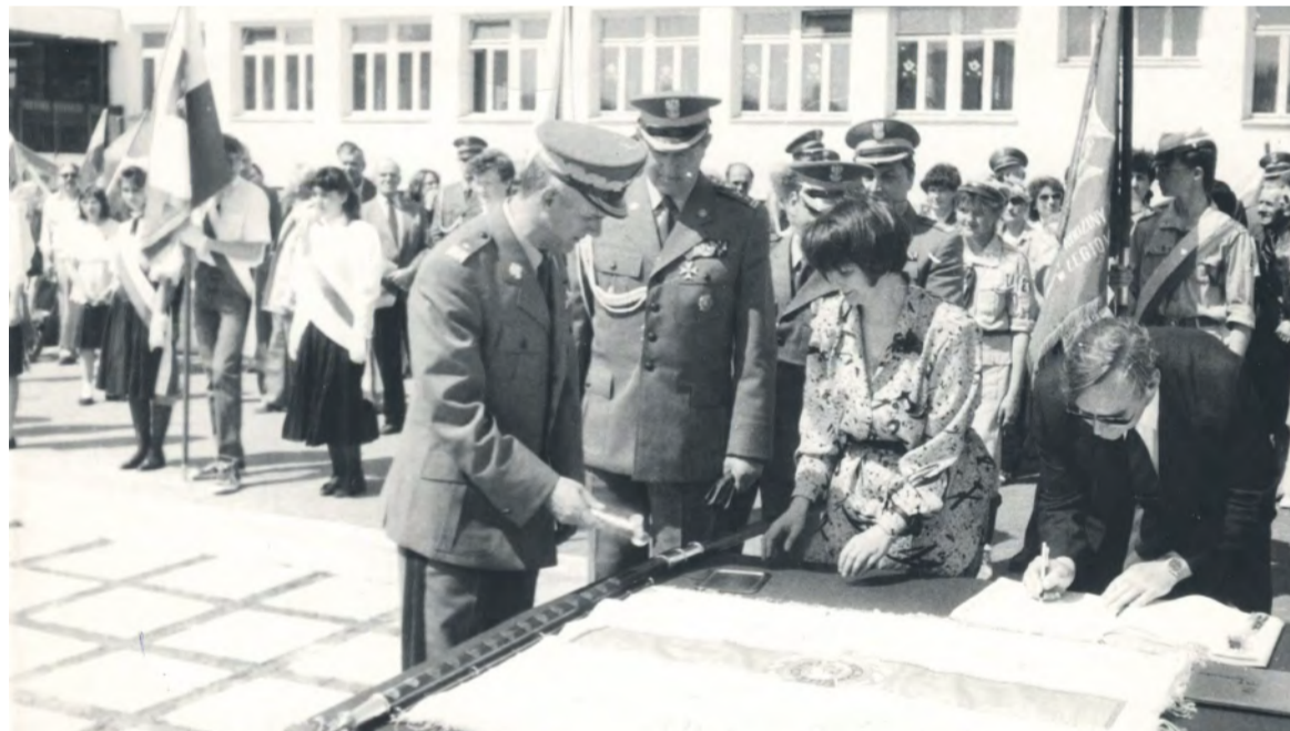
Uroczystość wręczenia sztandaru Szkole Podstawowej nr 8 w Legionowie, maj 1985

W artykule z 1988 roku kpt. T. Piekło pisał: „Na osiedlu Piaski w Legiono-