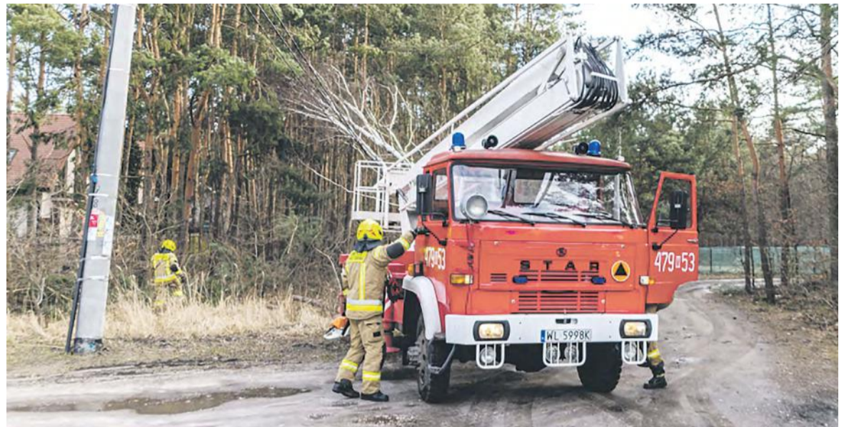
Na zdjęciu wóz strażacki podczas interwencji

Wykonawcą inwestycji była firma INTOP Warszawa Sp. z o.o.